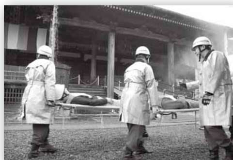
写真: 訓練に参加する消防団員 (平成27年文化財防火デー消防総合訓練)

市川市には地域ごとに23箇所に消防分団があり、平常時には地域の防災リーダーとして自治会などの訓練での指導、火災予防運動中や年末年始の安全パトロール、イベントでの広報活動などを行っています。 また火災・水害・地震等の災害が発生すると、いち早く駆けつけ、救助・救援活動を行います。