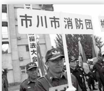
【問い合わせ】 消防局 警防課 333-2111 音声ガイダンス3番

市川市では、市内在住又は在勤で18歳以上の健康な方であればご自身でも入団することができます。 平成25年12月13日には「消防団を中核とした地域防災力の充実強化に関する法律」が公布され、消防団の強化や住民一人一人の防災への意識がますます重要となっています。 消防団の活動の中で、様々な経験や知識を得ることが出来ます。 地域社会の一員として、消防団に参加してみませんか。