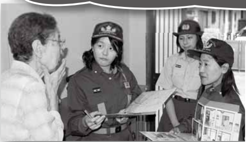
写真: 住宅用火災警報器の普及活動

現在は20歳代から40歳代を中心に11名の女性消防団員が活躍しています。高齢者世帯への防火訪問や、広報活動など女性の活躍できる場も多く、今後ますます女性消防団員を必要としています。