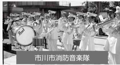
市川市消防音楽隊