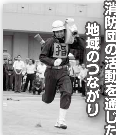
消防団の活動を通じた地域のつながり

消防団は全国で約2,200団、約87万人、市川市では平成27年1月時点で359人が消防団員として活動し、消防職員とともに地域防災の担い手となっています。 消防団員は普段は他に職業や学業をもつ非常勤特別職の地方公務員です。 性別や職業を問わず主婦、学生など、様々な方が、大切な家族や友人のため、「自分たちのまちは自分たちで守る」をモットーに活動しています。