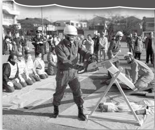
写真: 消防団員の訓練の様子 (市川市総合防災訓練)

災害時には消火活動や救助活動、消防団車両でのパトロールや広報活動、風水害の際には土のう積みなどの防災活動も行います。