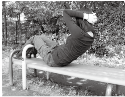
▲名前の入った器具を公園に設置

健康器具を新しく設置するため、寄付を募集します。設置する器具に寄付者の名前やメッセージを入れた真鍮製の記念プレートを取り付けます。人生の節目や団体の設立記念などの機会にいかがでしょうか。