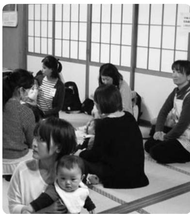
▲本光寺でのふれあい遊び