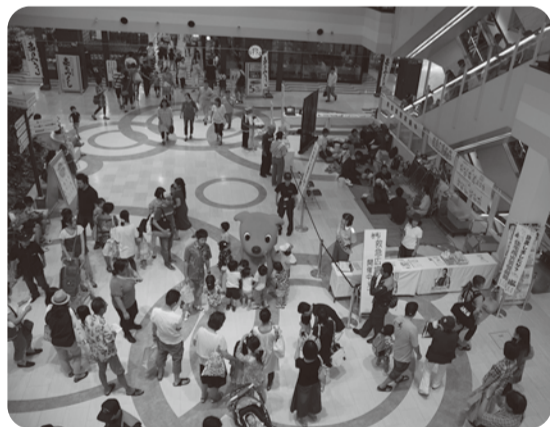
昨年の救急広場 中央にチーパくん

第37回 千葉県消防音楽隊フェスティバル開催 千葉県消防音楽隊フェスティバルは、音楽を通じた防災意識の啓発と地域との交流を目的として実施するものです。千葉県内の消防音楽隊が一同に会し、日頃練磨した演奏技術を披露いたします。その奏でるメロディーをぜひお楽しみください。 消防音楽隊員は、火災や救急などの消防活動に携わる一方、演奏活動を通じて、防火と防災意識の向上を目指し、啓発活動を推進しております。 フェスティバルは、千葉県下31消防本部中、消防音楽隊を保有している全13消防本部を4グループに分け、グループごとに演奏を披露いたします。市川市消防音楽隊も第3グループで演奏予定となっているほか、千葉県立市川高等学校吹奏楽部のみなさんにも協力いただき演奏してもらいます。みなさん、是非お誘い合わせの上、ご来場ください。