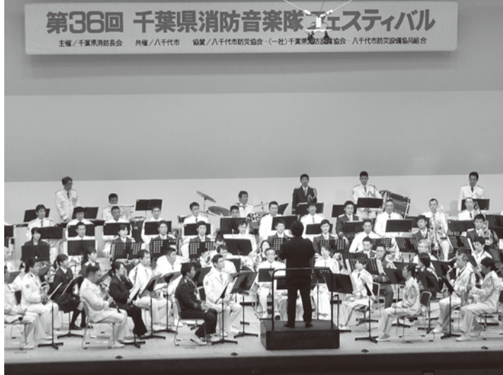
昨年八千代市で開催された時の様子

第36回 千葉県消防音楽隊フェスティバル 主催/千葉県消防協会 共催/八千代市 協賛/八千代市防災協会(一社)千葉県消防音楽協会 八千代市防災協議会聯合会 千葉県消防音楽隊フェスティバルは、音楽を通じた防災意識の啓発と地域との交流を目的として実施するものです。千葉県内の消防音楽隊が一同に会し、日頃練磨した演奏技術を披露いたします。その奏でるメロディーをぜひお楽しみください。 消防音楽隊員は、火災や救急などの消防活動に携わる一方、演奏活動を通じて、防火と防災意識の向上を目指し、啓発活動を推進しております。 フェスティバルは、千葉県下31消防本部中、消防音楽隊を保有している全13消防本部を4グループに分け、グループごとに演奏を披露いたします。市川市消防音楽隊も第3グループで演奏予定となっているほか、千葉県立市川高等学校吹奏楽部のみなさんにも協力いただき演奏してもらいます。みなさん、是非お誘い合わせの上、ご来場ください。 【日時】平成27年10月24日(土) 12時45分開演(12時15分開場) 【場所】市川市文化会館 大ホール 【料金】無料 ※事前予約等はございません。 当日自由席にてご覧いただけます。