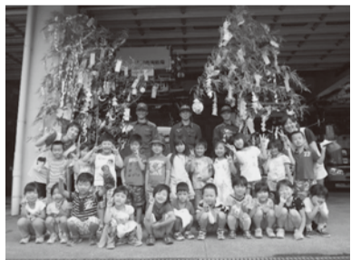
上:行徳保育園のみなさん 下:新浜幼稚園のみなさん

市川市南消防署では、初夏の風物詩である七夕に、管内の新浜幼稚園と行徳保育園の園児と一緒に将来の夢と防火の願いを込めて七夕飾りを作成し、道行く市民に火災予防を呼びかけました。