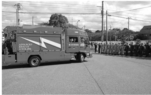
上「緊急消防援助隊出動の様子」 下「災害現場での検索活動」