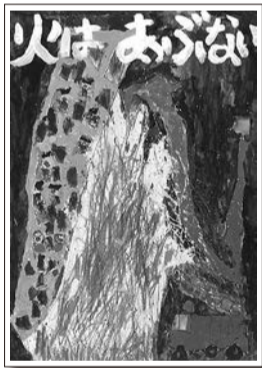
秋季火災予防ポスター