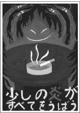
春季火災予防ポスター