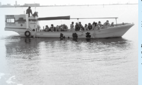
▲漁船に乗ることができる機会です

市川市魚食文化フォーラム実行委員会では、親子で漁業にふれ、市川の水産業への理解をより深めてもらうために、親子漁場見学会を実施します。地元の漁師と漁船に乗り、ノリやアサリなどの漁場を見学します。