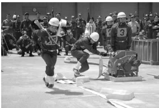
消防操法大会の様子

地域の安全パトロールはもちろん、消火活動や地域の人々とともに救助、救出、救護活動など、災害に備えてさまざまな訓練を行っています。毎年この時期には、消防機械器具の取り扱い訓練の基本である消防操法訓練を行い、その訓練の成果を発揮する「市川市消防団操法大会」が5月29日(日)に開催されます。この大会の各部門の最優秀チームは、6月26日(日)に我孫子市で開催される「第35回東葛飾支部消防操法大会」に出場し、県大会を目指します。 また、消防団員の募集は、随時行っていますので、活動に興味のある方は是非、左記連絡先までお願いします。