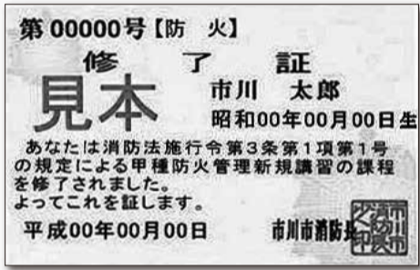
(例) 甲種防火管理新規講習(修了証)

消防局 予防課 Tel 333-2111 (音声ガイダンス①番 予防課) (平日9時～17時)