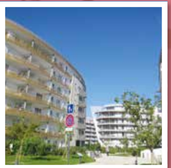
イッシー・レムリノー市(フランス)のフォル地区