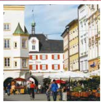
ローゼンハイム市(ドイツ)のマックスヨーゼフ広場