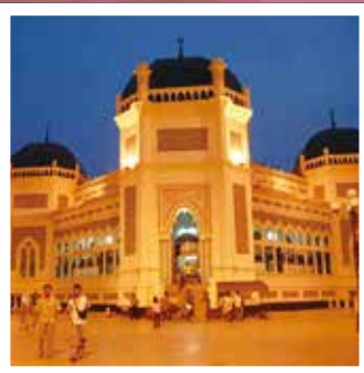
メダン市(インドネシア)のラヤ・モスク