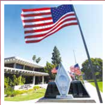
ガーデナ市(アメリカ)の市役所