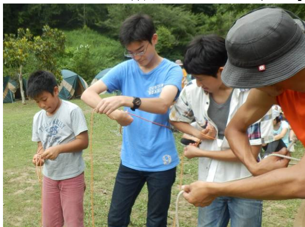
【ロープワーク実習】