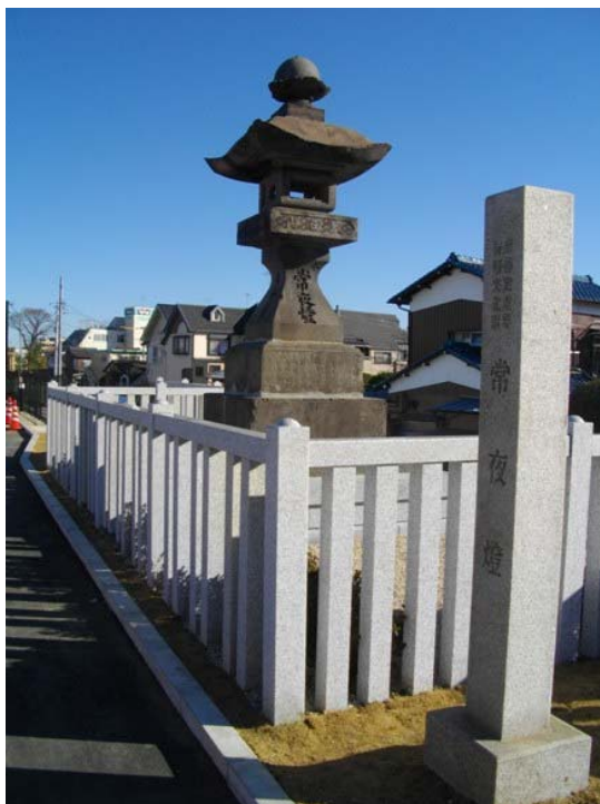
「常夜灯公園内に設置された常夜灯」