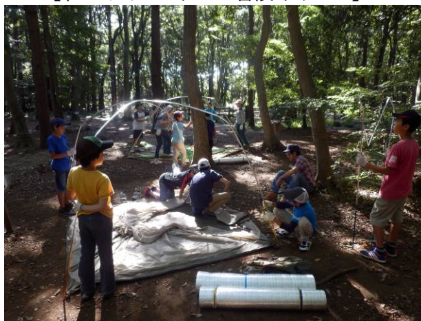
【みんなでテント張り】