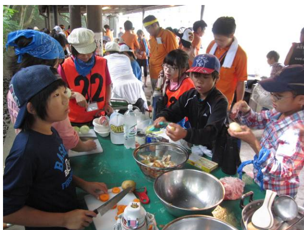
【カレーライス作り】