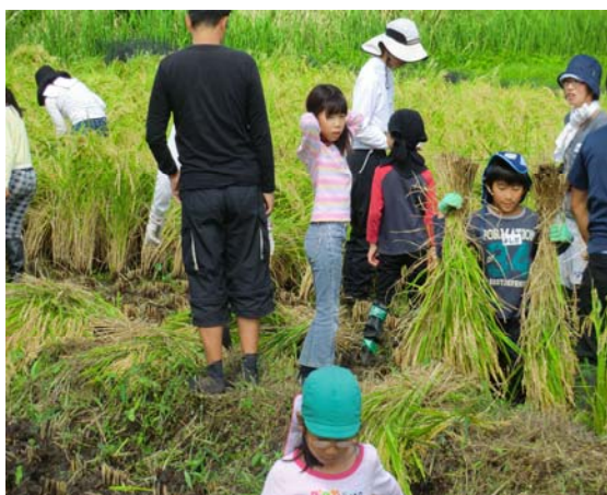
子ども水田の稲刈り風景