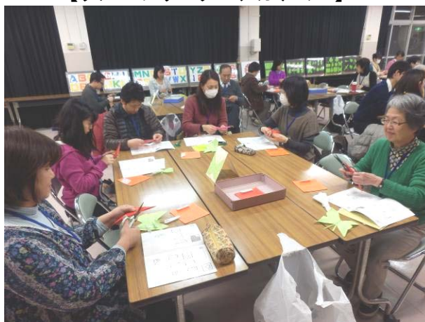
【ひと裁ち折り紙ワークショップ】