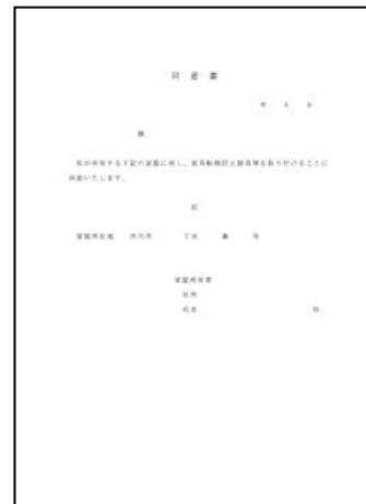
②同意書 ※賃貸借にお住まいの方