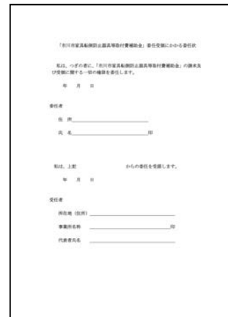
③委任状 ※委任受領払いをご利用の方