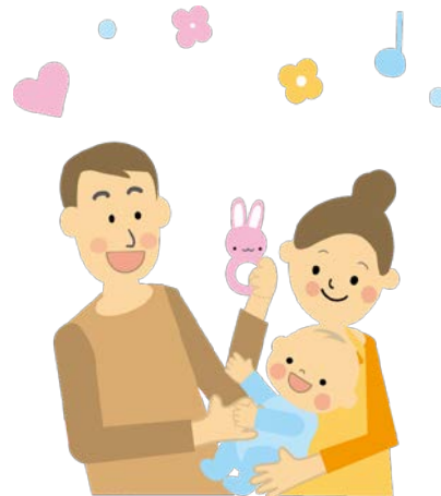
— 男性の育児休業取得率の変移 —

1992年に育児休業法が施行されて以降、育児休業は、女性だけでなく、男性も取得できるようになりました。男性の育児休業が広く周知されるようになり、育児休業制度を利用する男性も増えていきます。厚生労働省の7月26日の発表によると、2013年10月1日～2014年9月30日の1年間に配偶者が出産した男性の内、育児休業を開始した男性の割合は2.65%で、調査開始以来過去最高の数値を記録しました。10年前からのデータを見てもその割合は少しずつ増えてきており、女性だけでなく男性も育児休業を取得する風土ができてきているように感じます。