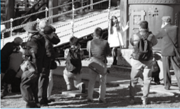
▲プロのモデルを招いて撮影します

プロカメラマンによるワンポイントレッスンもあります。初心者歓迎。 11月26日(土)午前10時(真間山弘法寺集合・受け付けは30分前)~正午(雨天決行)。ワンポイントレッスンを希望の方は午前9時集合 撮影場所 弘法寺、手児奈霊神堂など 抽選で40人 ¥1,000円 はがきまたはFAX711-1146に必要事項(6面上段参照)と、ワンポイントレッスン希望の有無と写真歴(初心者・初級者・中級者・上級者)を書き、11月16日(水)必着で同協会事務局 ☎711-1142同協会