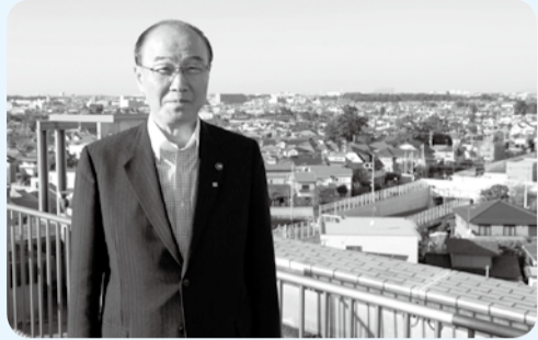
▲3・4・18号を背にまちづくりを語る市長

秋も深まり朝晩めっきり冷え込むようになりましたが、市民のみなさんは健やかにお過ごしでしょうか。