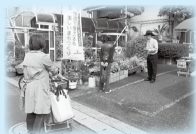
▲自慢のお庭です。ぜひお越しください

花の季節がやってきました。市民が丹精をこめて育てた庭や花壇が期間限定で公開されます。第12回を迎えるオープンガーデン(まちなかガーデニングフェスタ)は、4月と5月合わせて過去最多となる市内63カ所で実施されます。詳しくはパンフレットや市公式Webサイトをご覧ください。