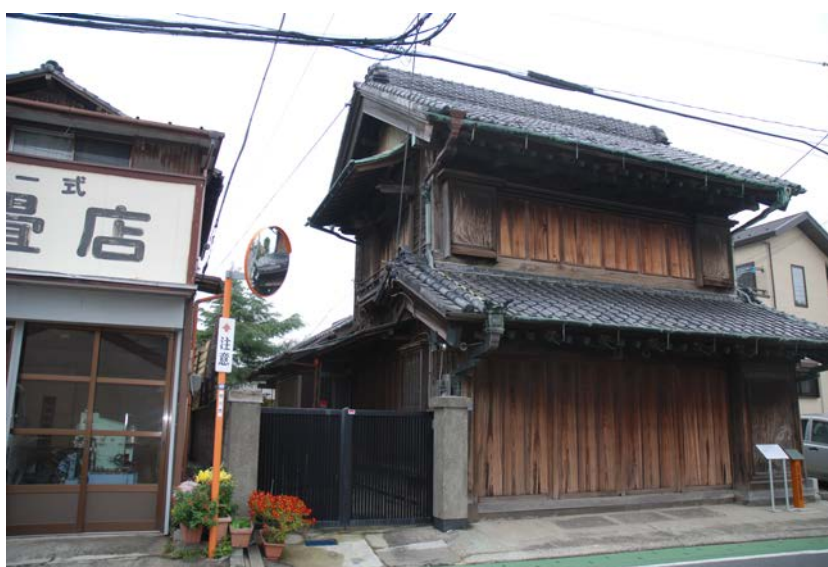
「国登録有形文化財として登録された旧浅子神輿店店舗兼主屋」