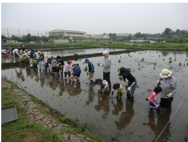
子ども水田 田植えの様子