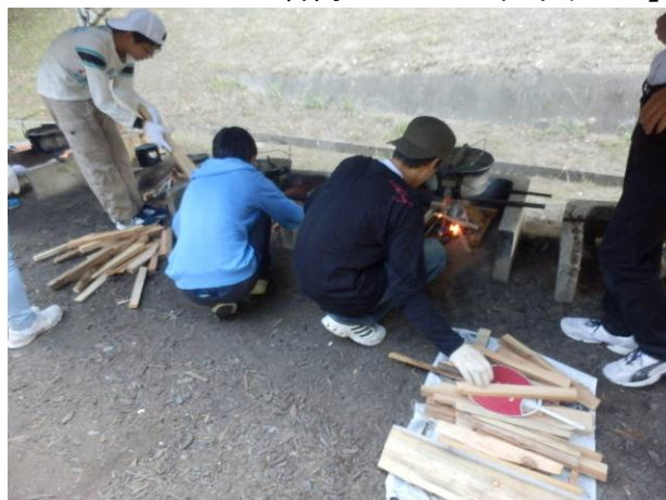
【野外炊さん かまどの準備】