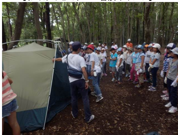
【みんなでテント張り】