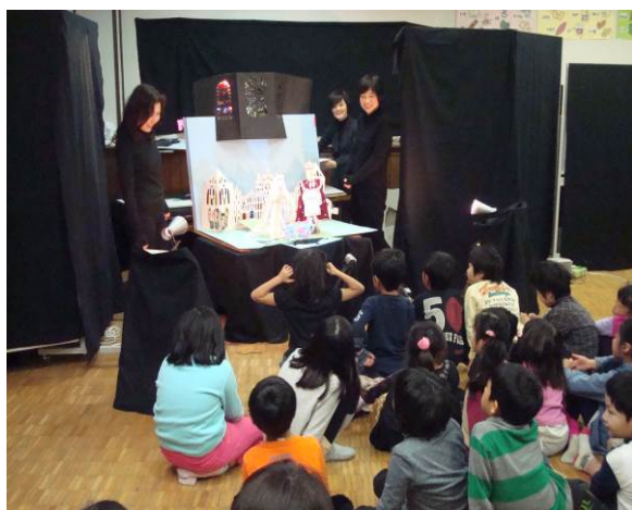
活動の様子② 【お楽しみ会】