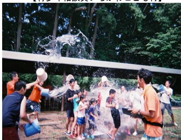
【水遊びを思い切り楽しもう】