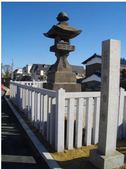
「常夜灯公園内に設置された常夜灯」