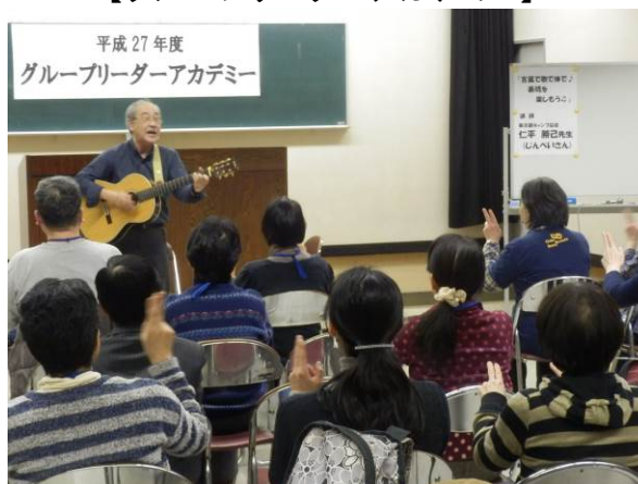
【キャンプソングを歌おう】