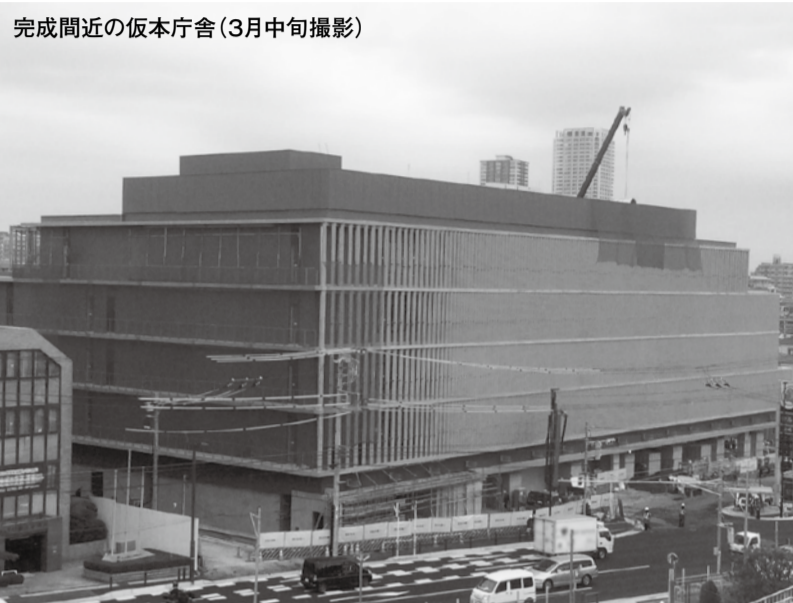
完成間近の仮本庁舎(3月中旬撮影)

防災行政無線テレホンサービス ☎0180-994-889 放送の内容が聞こえなかった時や確認したい場合にご利用ください。ただし、利用には通話料がかかります。(地域防災課)