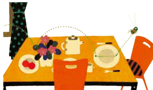
「ぼったくん」 1984 福音館書店