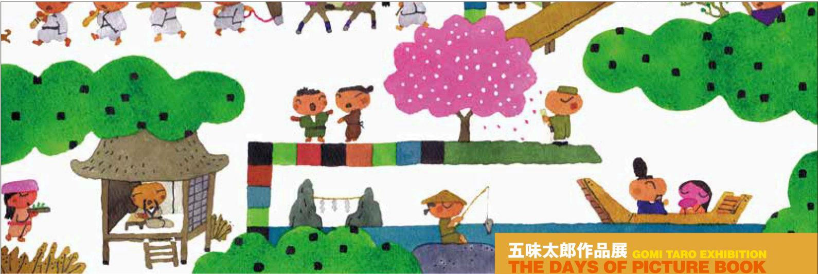
「百人一首ワンダーランド」2014 東京書籍

五味太郎作品展 GOMI TARO EXHIBITION THE DAYS OF PICTURE BOOK