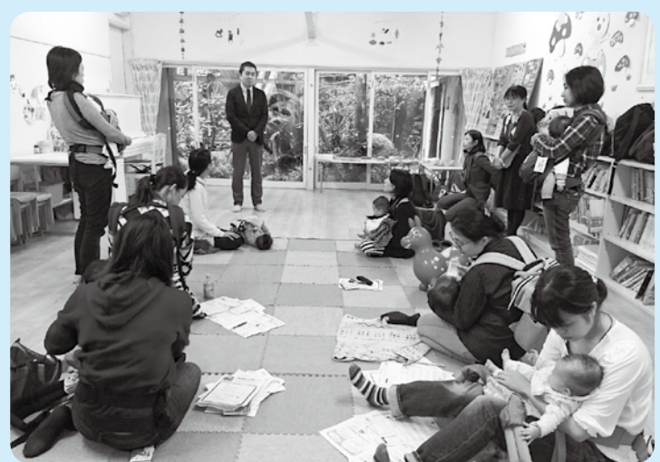
▲実際の様子を見て疑問を解決できます