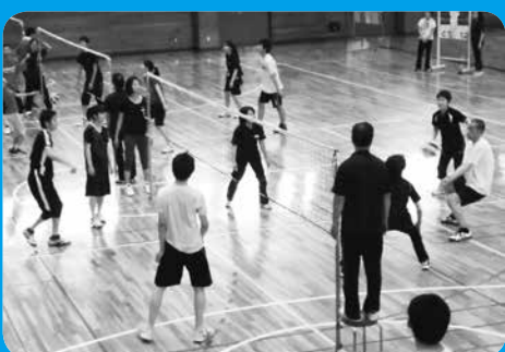
▲ミニバレーボールはチームで盛り上がりよう