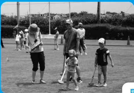
▲初心者でも楽しめます