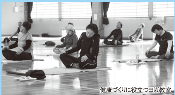
健康づくりに役立つヨガ教室