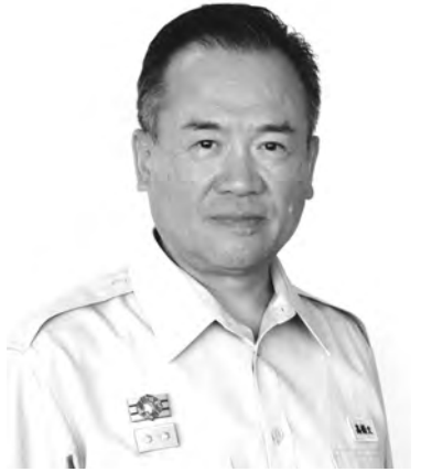
消防局長 高橋 文夫

機動化学隊は、N(放射性物質)B(生物剤)、C(化学剤)テロなどの災害や危険物、毒劇物などに起因する特殊な災害に対応するため、平成17年4月に発足しました。高性能な特殊資器材を活用し、原因物質などの特定のほか、危険性の高い汚染された現場からの人命救助や、救出された傷者の除染活動など、NBC災害現場において最前線で活動しています。現在西消防署に配置し、市内全域の特殊災害に対応しております。