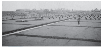
大正5年、原木地域の塩田の様子

江戸時代以降、日本国内では瀬戸内 地方などで製塩が行われており、行徳地 域も有力な製塩地でした。世界各地と の比較を紹介しながら、日本の製塩の歴 史について学びます。