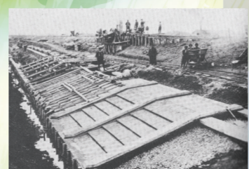
放水路工事の様子