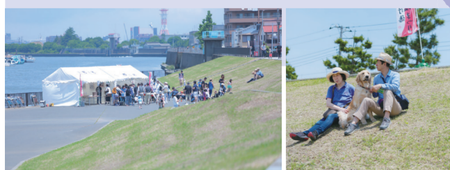
川を身近に感じることができる「川まち 行徳 塩まつり」

工事にあたり、家などを動かしたのですが放水路の場所にあつたと思われ春日神社が行徳の胡録神社の敷地にあるのは、その証です。 「この被覆を防ぐため、大正5年から放水路を掘削したのですが、堤防の部は地元の人材が力を合わせて人力で造ったそうです。当時手作業もあり大変苦労したと思います。」 「昔祖父から聞いた話ですが、放水路ができる前は田畑が広がっていました。八幡と行徳は地続きで、我が家は現在の行徳橋の上流にあつたそうです。水害を何度か被り、風呂桶が約3キロメートル先の本八幡付近まで流されたこともあつたよ。」