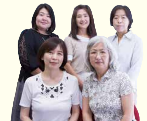
▲ファミリーサポートセンターのスタッフ

保育士や幼稚園教諭の資格を持ったアドバイザーがサポートする他、研修体制も充実しています。