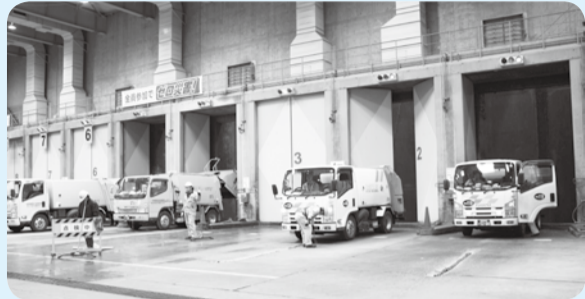
平成29年4月～8月(5カ月間)の排出量(速報値)比較【単位:トン】

市では、さらなるごみの減量・資源化を進めるため、平成29年4月からごみ収集回数を変更しました。4月～8月の5カ月間の燃やすごみの収集量については、前年度の同時期と比較して1,158トンの減量ができました。 一方で、資源物のうち雑がみを含む雑誌やダンボール、布類は増加しており、市民のみなさんの減量や分別に関する努力の成果が表れたものと考えられます。 今後も、引き続きごみの減量・資源化にご協力をお願いします。