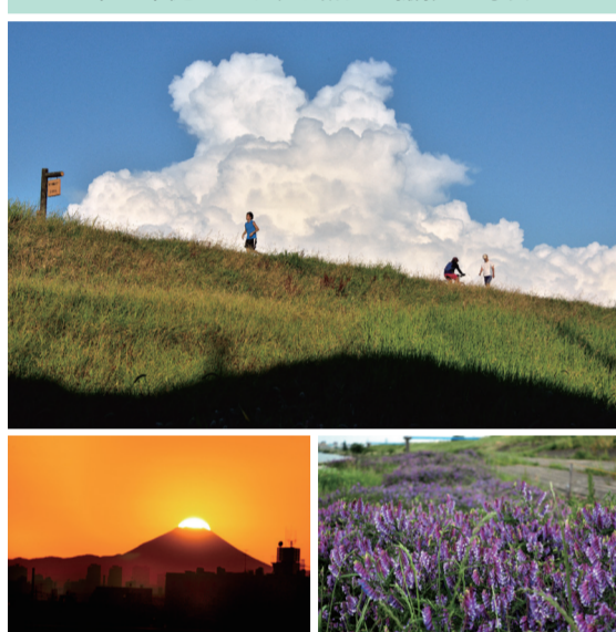
佐々木健さんが江戸川沿いで撮影した写真