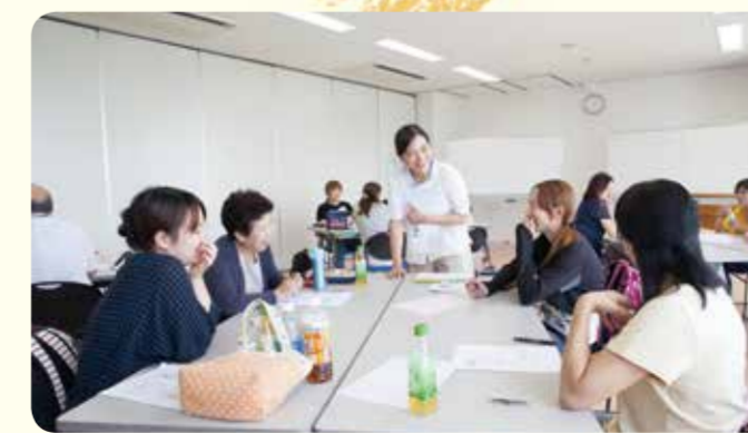
▲生後2カ月からの乳児を預かる方を対象とした「産明けサポーター養成講座」

保育士や幼稚園教諭の資格を持ったアドバイザーがサポートする他、研修体制も充実しています。