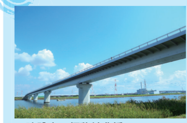
▲建設中の仮称妙典橋

多くの歴史を積み重ね、今がある江戸川。今年、常夜灯公園にあずまやが新設されます。平成31年には妙典橋の開通、平成32年に行徳橋架け替えが予定されています。