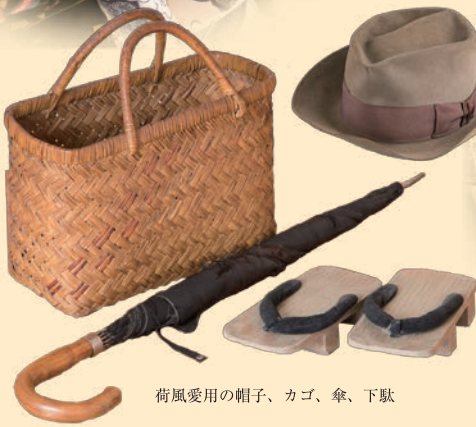
荷風愛用の帽子、カゴ、傘、下駄