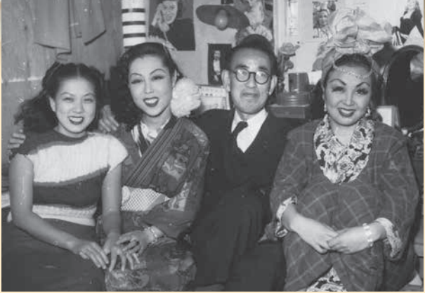
ロック座楽屋で踊子たちと