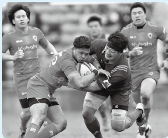
▲大興奮の試合が目の前で(昨年の様子)

日12月24日(日)午前9時(市川南仮設庁舎集合)～午後5時解散予定 場フクダ電子アリーナ(千葉市中央区川崎町1-20) 人市内在住・在学の小学生とその保護者、抽選で20組40人 ¥1,000円、子ども無料 申市公式Webサイト、または、往復はがきに親子氏名、ふりがな、年齢(子どもは学年)住所、連絡先を書き、12月11日(月)必着でスポーツ課(〒272-0827国府台1-6-4) ☎☎373-3112同課