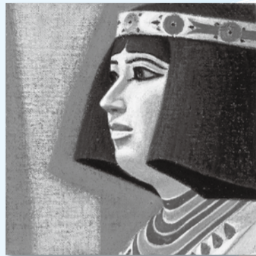
▲杉山寧《ネフェルト》、文藝春秋1965年1月号表紙、1965年、蘭島閣美術館蔵