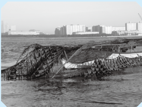
▲ノリが育つ網の下に船がもぐり込み、ノリをつみとります