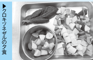
▶クロキツネザルの夕食