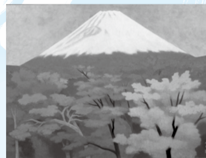
▲東山魁夷《秋映》1959年、株式会社歌舞伎座蔵

日12月9日(土)～平成30年1月28日(日) 場東山魁夷記念館 場一般700円、65歳以上560円、高校生・大学生350円、中学生以下無料 休館日 月曜日(祝日の場合は、翌平日)、12月28日(木)～平成30年1月2日(火)、4日(木) ☎0336-2011同館