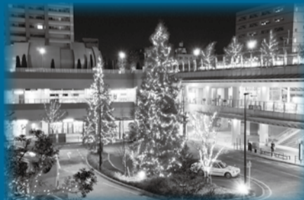
▲冬空をイルミネーションが彩ります

日12月16日(土)午後3時30分～8時 場JR総武線市川駅、ノブコイシカワ、ニッケコルトンプラザ、文化会館、東京メトロ東西線行徳駅など市内各所(変更の場合あり) 人市内在住・在勤・在学の方、先着25人(中学生以下は要保護者同伴)※1度の申し込みにつき4人まで 申12月4日(月)～11日(月)に☎712-8596まち並み景観整備課