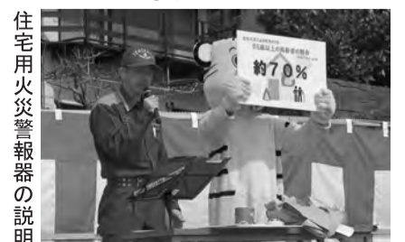
住宅用火災警報器の説明