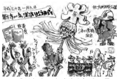
平成30年市川市消防出初式風景