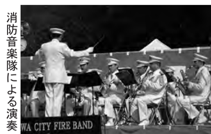
消防音楽隊による演奏

【問い合わせ】 消防局予防課(平日午前9時から午後5時) TEL 047-333-2111(音声ガイダンス①番)