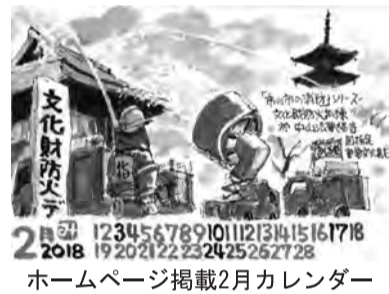
平成30年市川市消防出初式風景

昭和20年山口県下関生まれ。平成15年秋、年間勤務した鉄鋼会社を58才で退職。子供の頃から夢であった「冒険」と「お絵描き」を挑戦。個展の開催や講師、月刊いちかわでの連載と広く活躍されています。