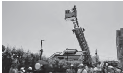
はしご車試乗体験