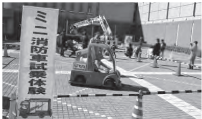
ミニ消防車試乗体験