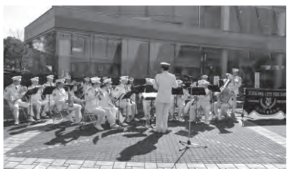
消防音楽隊の演奏

はしご車試乗体験、ミニ消防車試乗体験、放水体験、救助体験、AED取扱訓練、消防音楽隊の演奏、地震体験など