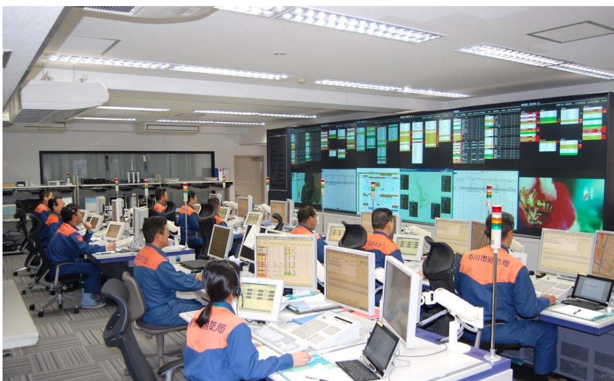
千葉北西部消防指令センター