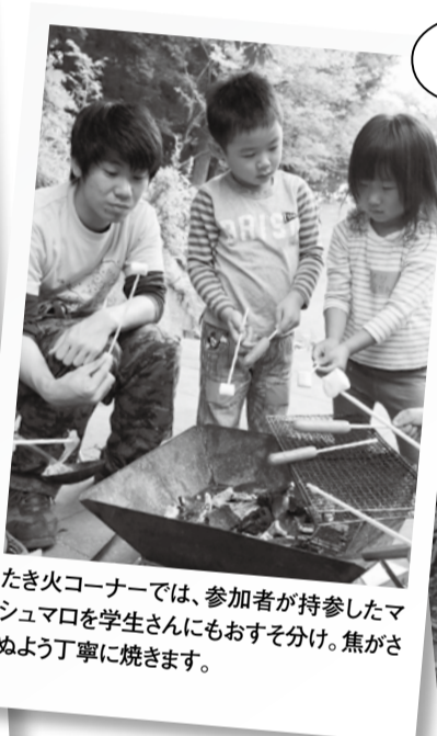
たき火コーナーでは、参加者が持参したマシュマロを学生さんにもおすそ分け。焦がさぬよう丁寧に焼きます。