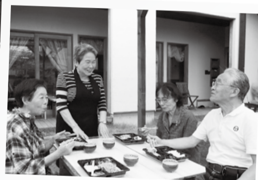
「ここで仲間と一緒に食べるお弁当は、週1回の楽しみなんです」と、利用者の方。食後はオアシス室内での卓球タイムでひと汗かくのが恒例。