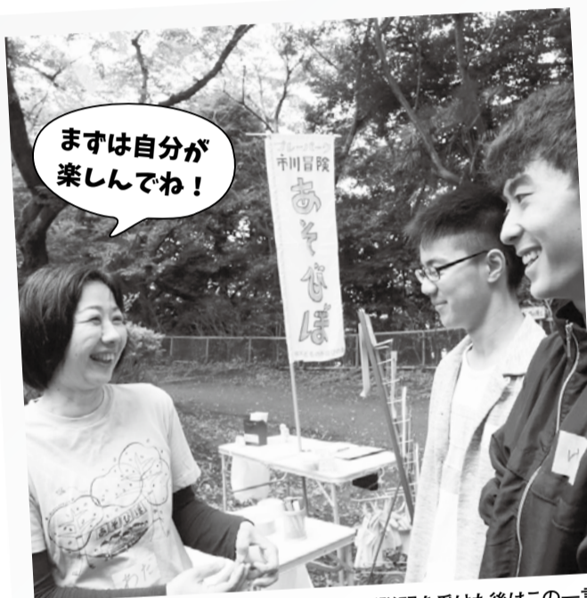
この日初めて参加した学生。注意事項など説明を受けた後はこの一言で送り出され、思わず笑顔に。

※プレーパークは参加無料、事前申込不要。活動日時や場所は同会Webサイトをご覧ください。