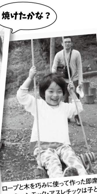
ロープと木を巧みに使って作った即席ハンモックやアスレチックは子どもたちに大人気。みんなで作った遊び場での笑顔が弾けます。