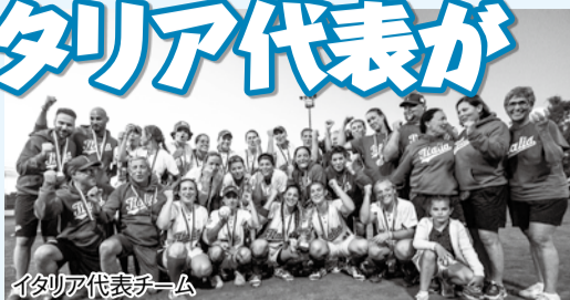
イタリア代表チーム

今年の8月、世界女子ソフトボール選手権大会が千葉県内4市(千葉・成田・習志野・市原)の会場で開催されます。この大会の開幕戦で日本代表と対戦するイタリア代表が、本市で事前キャンプを行います。期間中のトレーニングや練習試合を見学できます。