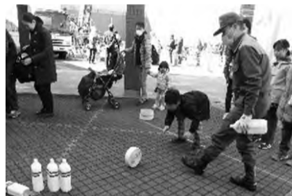
本物のホースを投げてみよう!