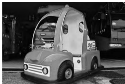
ミニ消防車に乗って出動!

【日時】平成30年11月11日(日) 10時30分から12時30分 ※雨天の場合は中止となります。 【場所】鬼高1丁目1番1号 ニッケコルトンプラザ コルトン広場 【問合せ】消防局 予防課 指導担当 TEL 047-333-2111 (音声ガイダンス①番)