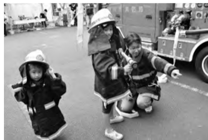
防火衣を着て消防士になりきろう!