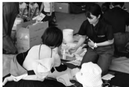
応急手当を学ぼう!