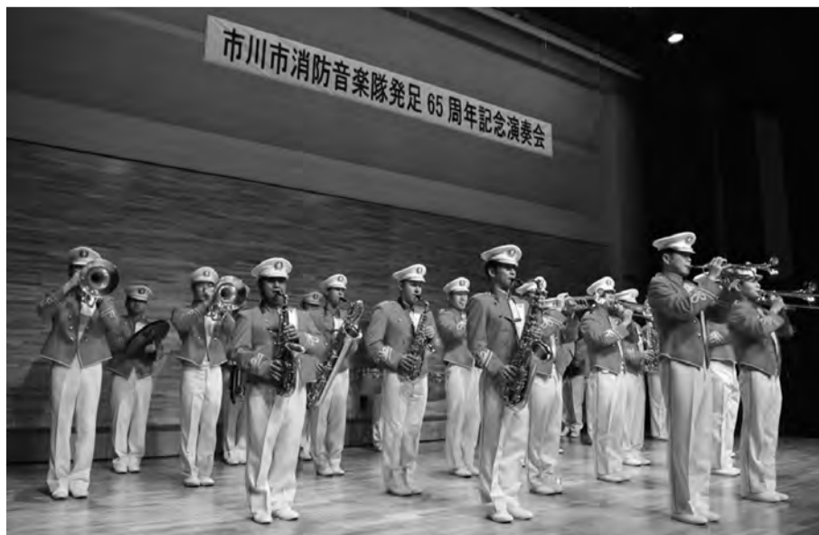
火災予防 ～音に想いをのせて～