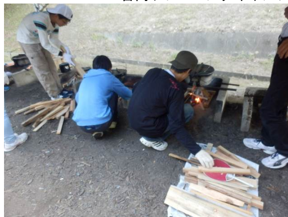
【野外炊事 かまどの準備】