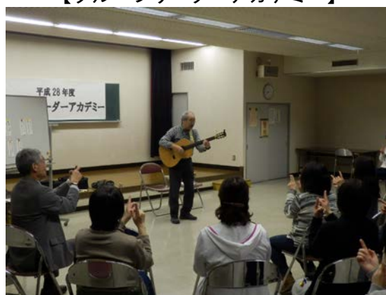
【言葉で 歌で 体で 表現を楽しもう】