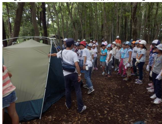
【みんなでテント張り】