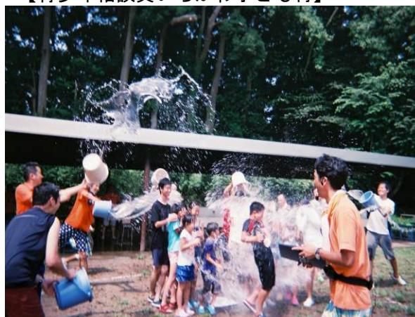
【水遊びを思い切り楽しもう】