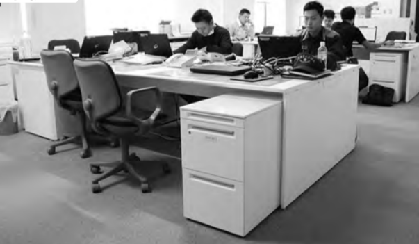
▲▼ フリーアドレスを採用した事務室。窓際に非番員のキャスターワゴンを収納し無駄をなくしています