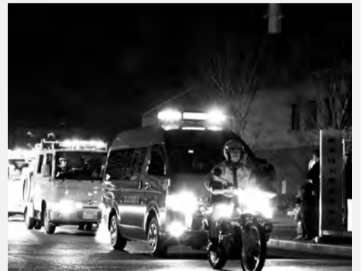
出動し夜間の警備体制を強化します