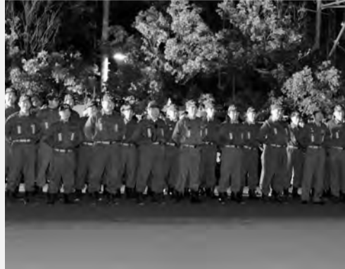
出動前に服装点検実施

平成30年12月14日(金)に平成30年歳末特別警戒出動式を行いました。歳末特別火災予防運動期間中は夜間警備体制強化のため消防団員を動員し、20時～23時まで管轄区域内の巡ら警戒及び放送宣伝を行い、火災予防の徹底を図ります。