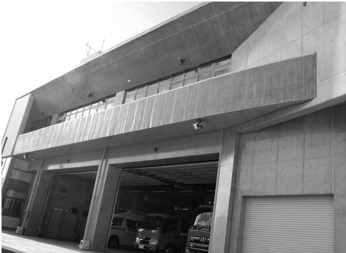
東京湾や国道357号線を管轄区域とする出張所です。市内で唯一の消防艇を配備し、船舶火災や水難事故等あらゆる災害に出動し、市川市の安全・安心を担っています。