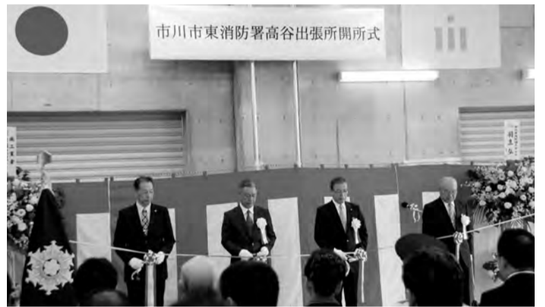
市川市東消防署高谷出張所開所式