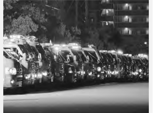
出動態勢が整った車両