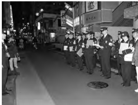
特別査察を実施しています

・市内の駅、各消防署所、各消防団詰所に懸垂幕や立て看板を掲出し、火災予防思想の普及啓発を図っています。