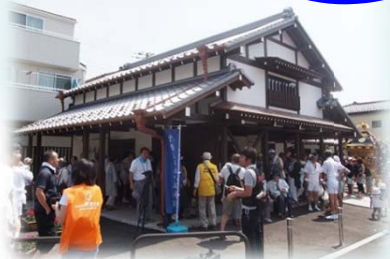
主屋も休憩所も大賑わい