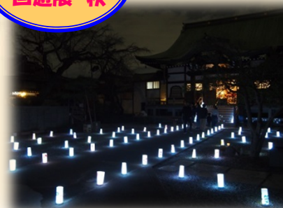
夜は寺社をあんどんでライトアップ