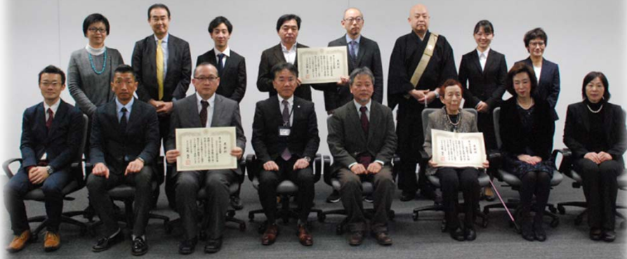
第12回市川市景観賞受賞者の表彰式の様子 (平成31年2月4日(月) 於: 市川市役所)