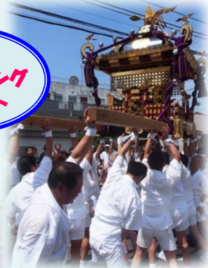
大迫力の神輿揉み