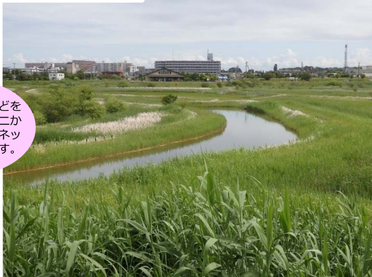
大柏川第一調節池緑地