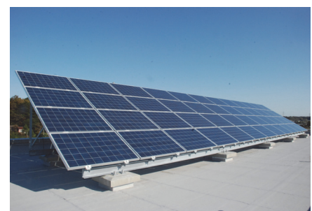
北消防署の太陽光発電