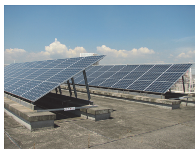
妙典中学校の太陽光発電