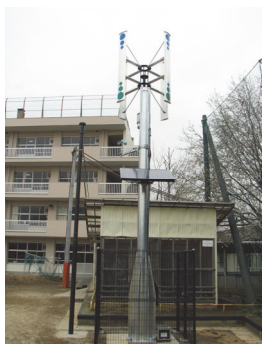
国府台小学校の風力発電