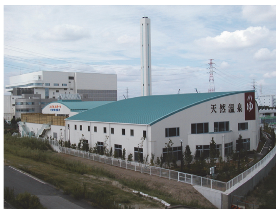
クリーンスパ市川全景（奥に市川市クリーンセンター）

なお、この施設はPFI事業で運営され、民間の資金やノウハウを利用し、施設の設計から建設、整備後の運営、維持管理までを民間事業者が行っています。