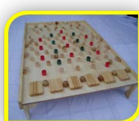
【コロコロコリント】