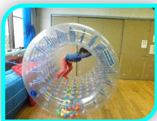
【サイバーホイール】