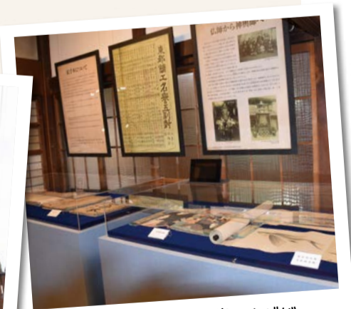
行徳にゆかりのある資料などが展示されている