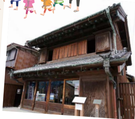
行徳の歴史や文化が学べる