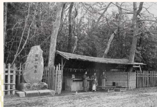
▲八幡の藪知らず