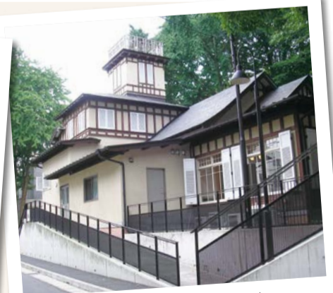
旧木内別邸の洋館部分を復元・再築した建物です。

☑ 真間4-11-4 開館時間:午前9時～午後5時 休館日:月曜日(祝日の場合は翌平日)、年末年始(12月28日から1月4日) ☎371-4916