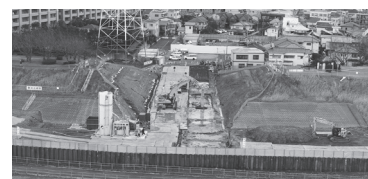
▶市川南ポンプ場の新設工事