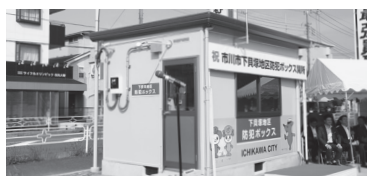
▶下貝塚・北国分地区の防犯ボックスの設置