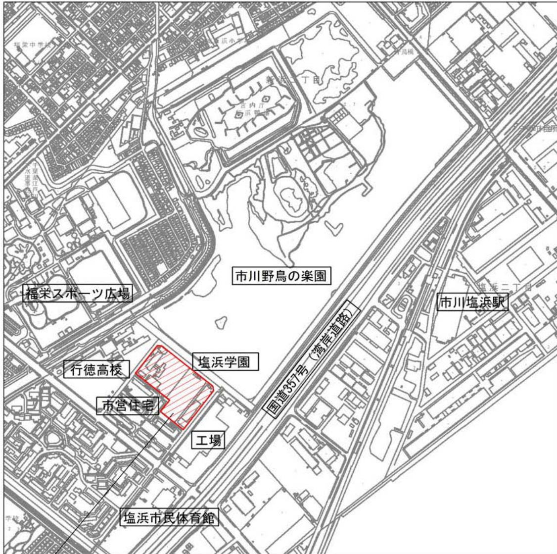
議案第57号の参考図1

工事場所：市川市塩浜4丁目5番1号 (地名地番：市川市塩浜4丁目16番1の一部)