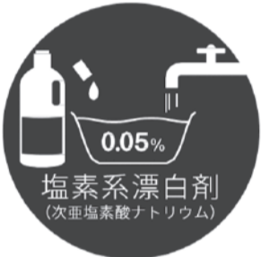
塩素系漂白剤 (次亜塩素酸ナトリウム)

食器や箸などは、80°Cの熱水に10分間さらすと消毒ができます。火傷に注意してください。