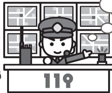
119 消防指令センター