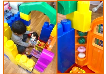
大型ブロックで上手におうちができました。ドアのくぼみを棚にしてきれいに飾られているアイデアがステキ！

山崎製パン従業員組合デイリー支部さんより寄付いただきました。ひよこのかたかた押し車、紙芝居、身長計、絵本の数々。うれしいですね。ありがとうございました。新しい押し車をみつけ、「みてー新しいの買ってもらったよー。」とおさんにニコニコ笑顔で話しているかわいいお母さんもらっちゃいました。(o^)