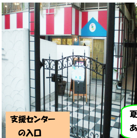
支援センター の入口