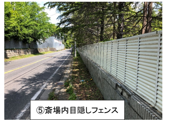
⑤斎場内目隠しフェンス