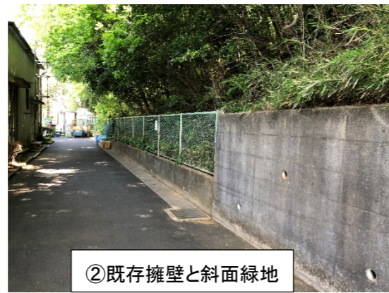
②既存擁壁と斜面緑地