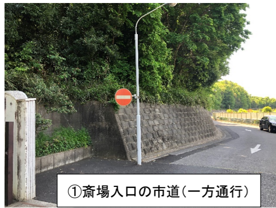
①斎場入口の市道(一方通行)