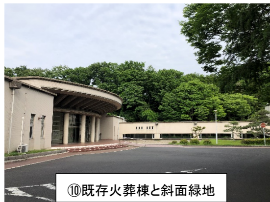
⑩既存火葬棟と斜面緑地