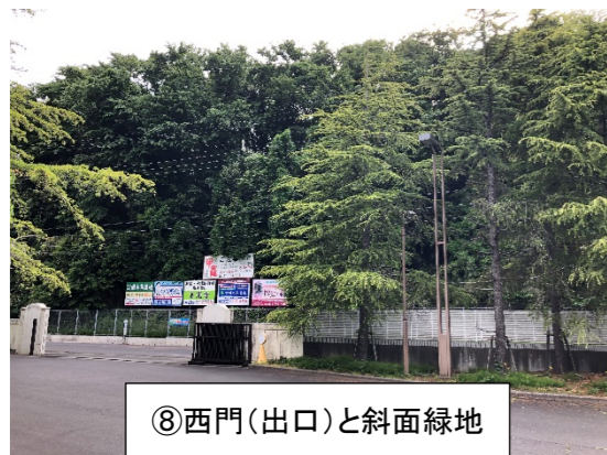
⑧西門(出口)と斜面緑地