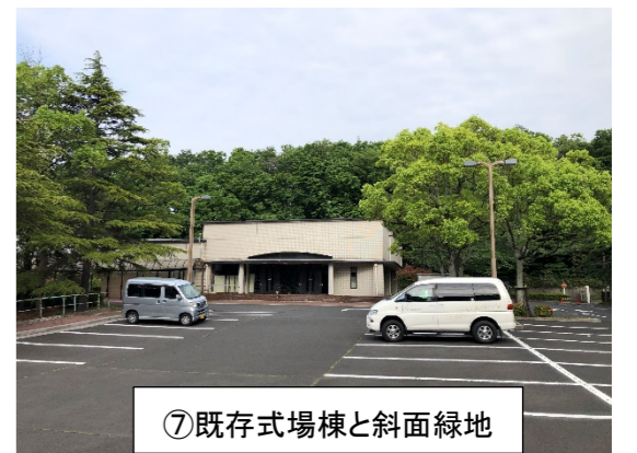
⑦既存式場棟と斜面緑地