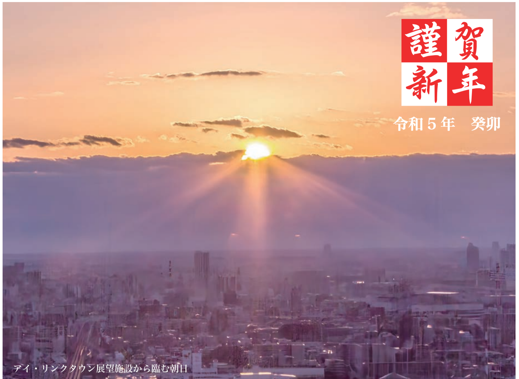
アイ・リンクタウン展望施設から臨む朝日