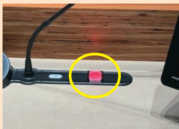
採決時に使うボタン

議員の定数は42人で、4列に配置されています。議員席にはマイクのほか、発言の残り時間などを表示する小型モニターや、採決時に使うボタンなどがあります。