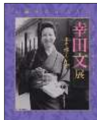
幸田文展 図録 定価500円(税込)