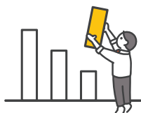
みなさまの主体的な取組