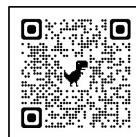
オンライン申請 QRコード