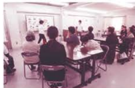
今日からはじめる美味しい減塩生活 (鬼高公民館)

動画視聴に伴う通信費は、受講者様負担となりますのでご注意ください。Wi-Fi環境下での視聴を推奨します。