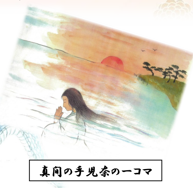
真間の手見奈の一コマ