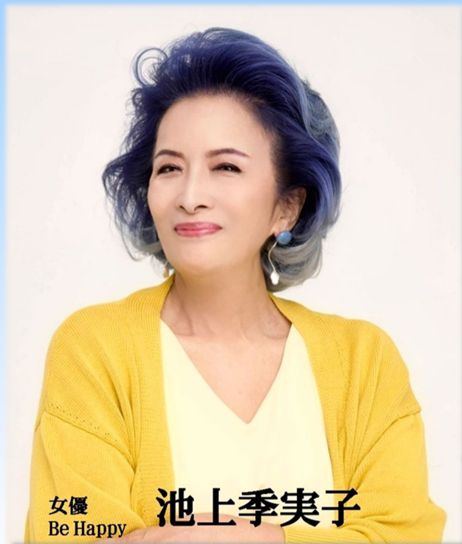
女優 Be Happy