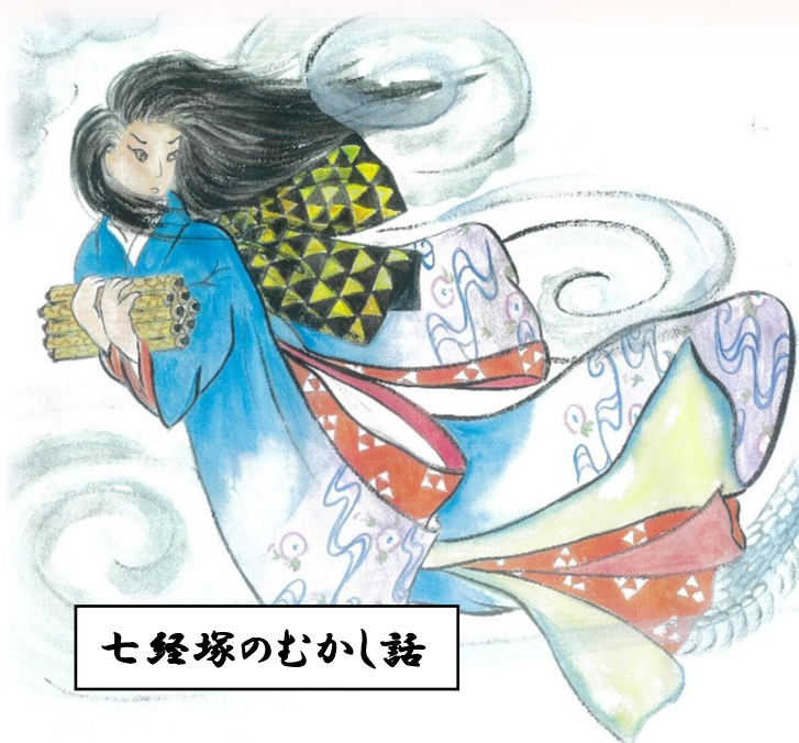
七経塚のむかし話