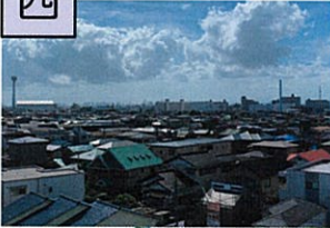
とくがんじ 徳願寺